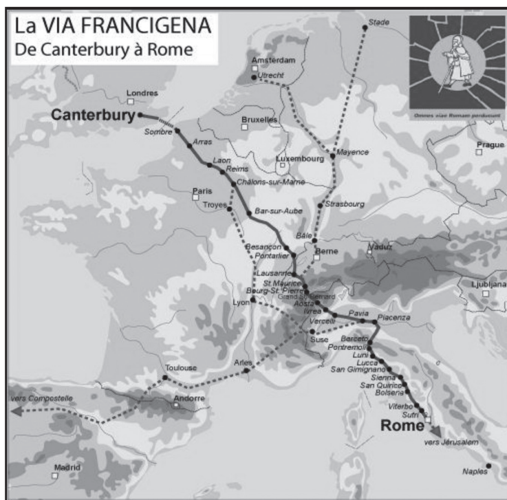
Figura 1. La via Francigena

Il re, in pratica, allude alla via Francigena, quella strada che da Canterbury collegava la Francia e la Svizzera a Roma: