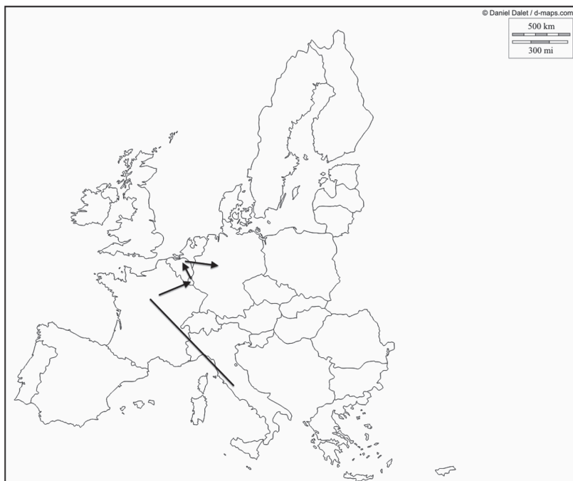
Figura 2. Il percorso di Sevilla

Le frecce indicano il percorso verso l'Ungheria, mentre la linea retta quello della via Francigena.