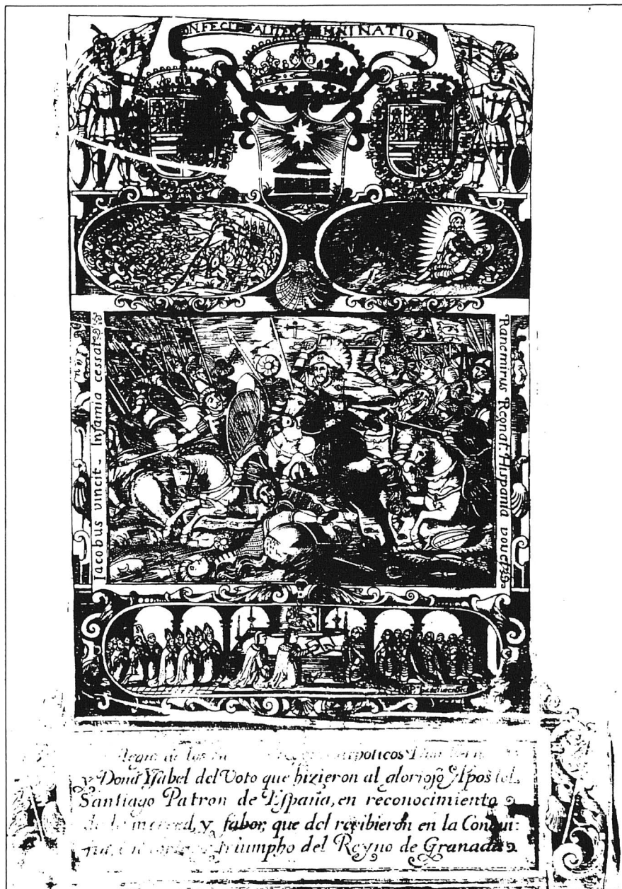
Privilegio de Voto de Granada. Alcalá de Henares, 1492 (copia impresa).